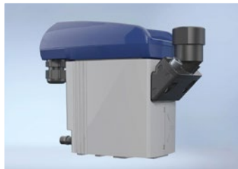
DRYPOINT® RA eco