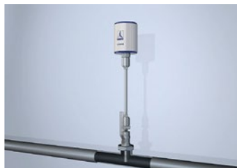
CLEARPOINT® - Wasserabscheider